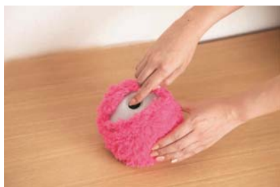
ボタンを長押しスタート。