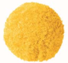
カナリアイエロー(CZ-562-CY)