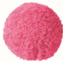
フラミンゴピンク(CZ-526-FP)