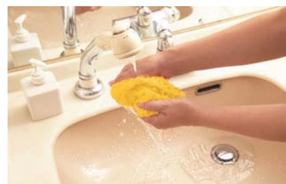
汚れたらカバーを外して手洗い可能

「モコロ」は、全国の家電量販店、雑貨専門店、通販に加え、一部ペット専門店などでも販売されています。