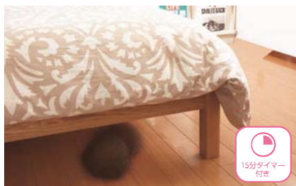
ベッドの下等に入りこみます。