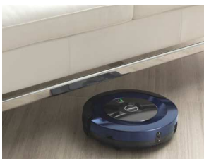
薄型コンパクトボディでソファやベッドの下もお掃除。

直径280×高さ70mm、重量1.6kgの業界最小級タイプながら基本性能をしっかりと揃えています。小廻りのきいたお掃除が得意、薄型ボディなので高さ70mmまでのソファやベッドの下もキレイにしてくれます。こちらにもデュアル回転ブラシが搭載されており、壁際のごみをしっかり吸引します。落下防止センサーも搭載、段差は7.5mmまで乗り越えます。一回のお掃除時間は50分、最大お掃除面積は20畳です。電池が切れると充電ステーションに自動で戻ります。充電時間は約7.5時間、24時間タイマー搭載。