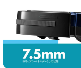
高さ7.5mmでの段差を乗り越えます。