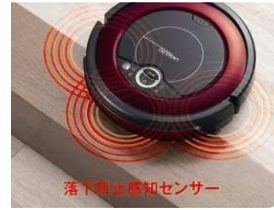
落下防止センサー搭載 (高さ10cm以上の段差を感知)