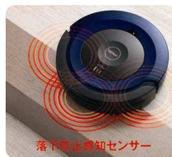
落下防止センサー搭載 (高さ10cm以上の段差を感知)