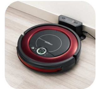
オートチャージシステム

落下防止センサーで階段なども回避します。15mmまでの段差であれば乗り越えることが可能、たたみはもちろんカーペットやマットなどは乗り越えてお掃除を継続します。一回のお掃除時間は60分間、最大お掃除面積は25畳です。お掃除終了後は自動で充電ステーションに戻ります。充電時間は約8時間、24時間タイマー機能でお掃除時間の予約セットが可能です。自動モード以外にもリモコンによる操作も可能、いたれりつくせりのハイグレードモデルです。直径295×高さ75mmのコンパクトサイズで本体重量は1.9kgと軽量です。