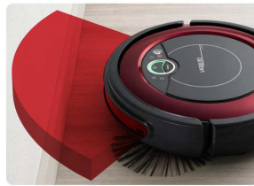
IR 壁検知センサーで壁にぶつかりません。

4つのIR 壁検知センサーが壁や障害物を感知して回避します。壁づたいにお掃除する際に、お部屋の壁や家具を傷める心配もありません。(センサーと壁との角度によってはぶつかる場合があります)デュアル回転ブラシ搭載で隅まできっちりとかきこむので壁際のごみもしっかりと吸い込みます。