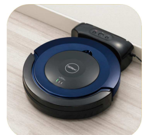
オートチャージシステム