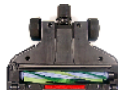
エアタービンブラシ搭載