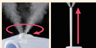
ツインノズル ロングノズル